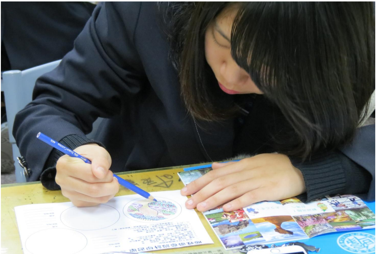
體驗活動：龍谷高校學生參考觀光局手冊繪製台灣意象紀念徽章。