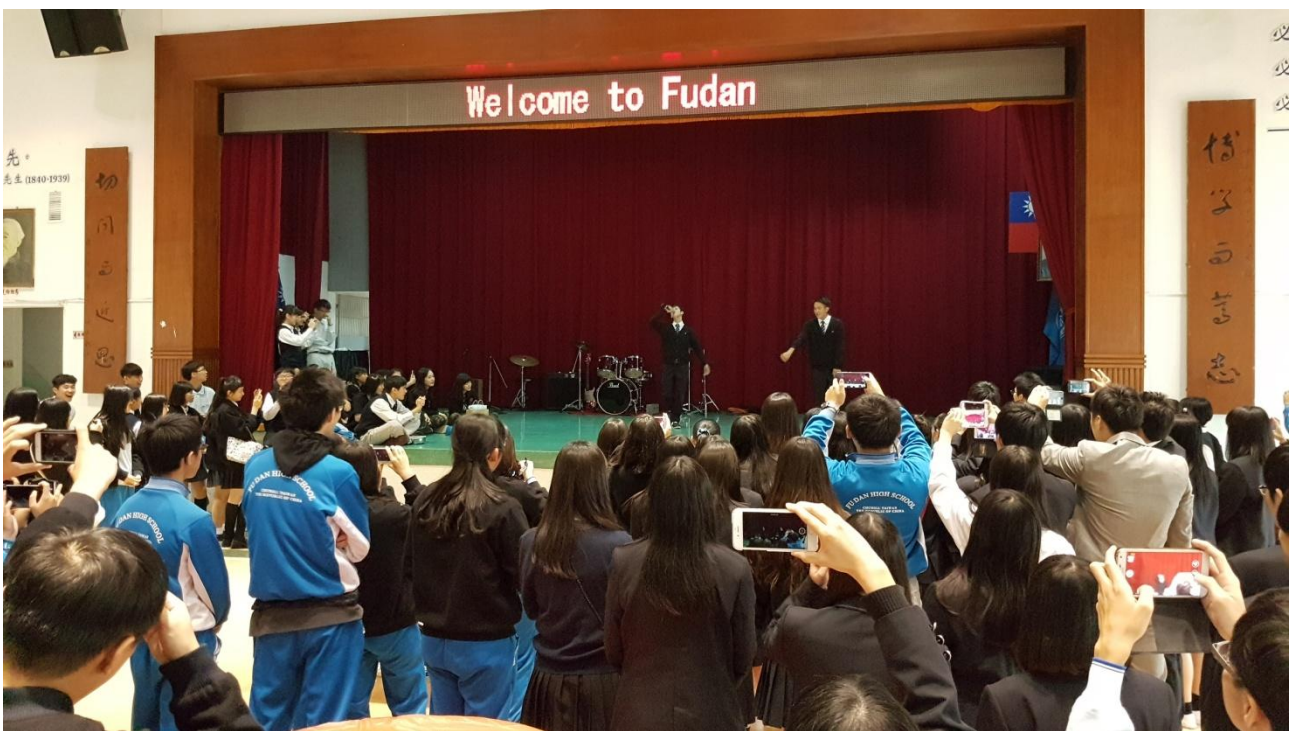
龍谷學生上台即興表演，氣氛熱烈。