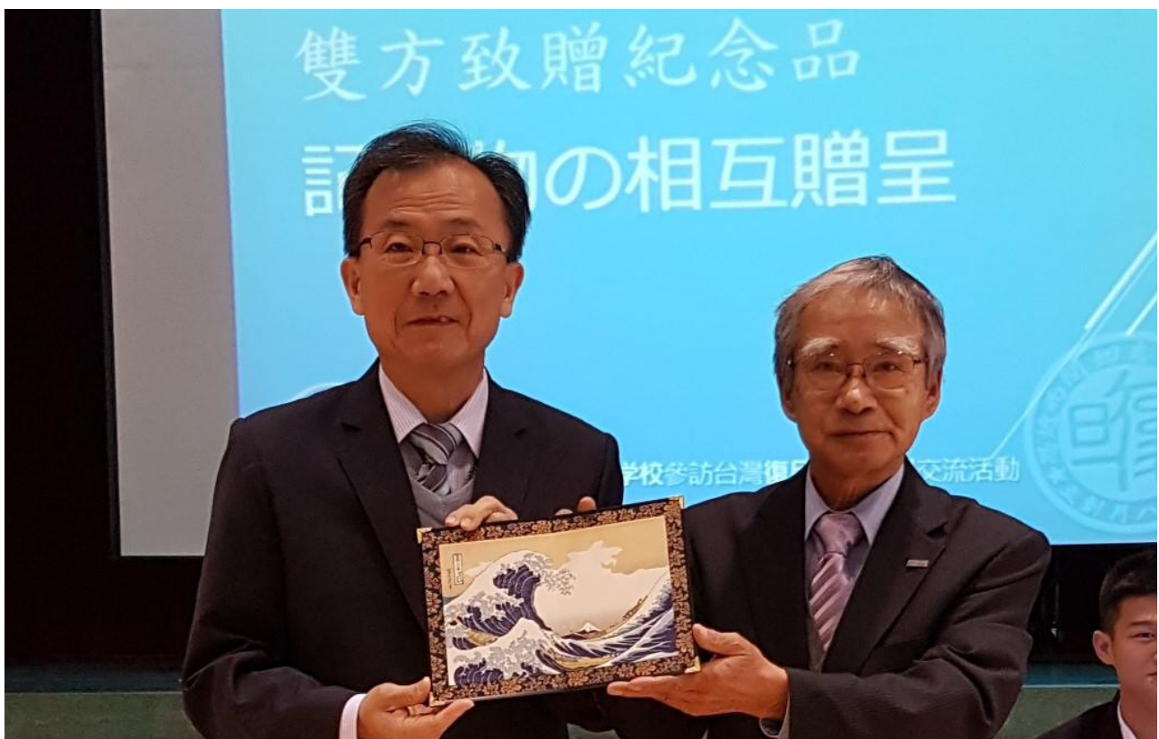
龍谷高校回贈葛飾北齋名作「神奈川沖浪裡」精美屏風一幀。