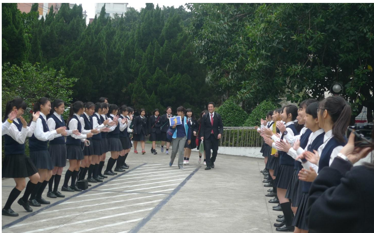
復旦禮儀隊熱烈歡迎龍谷高校師生。