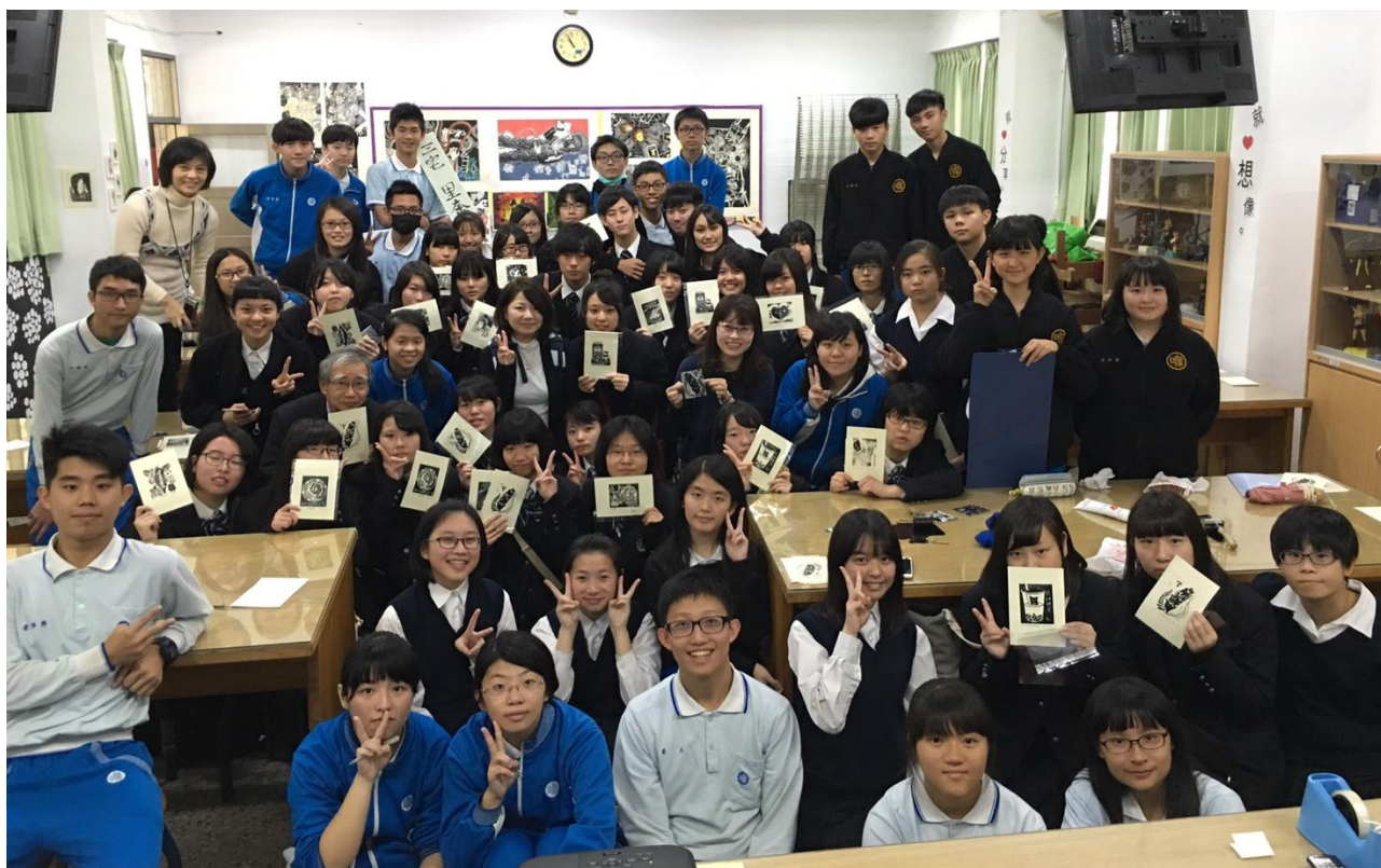
體驗活動：兩校學生在完成台灣意象版畫印製後合影。