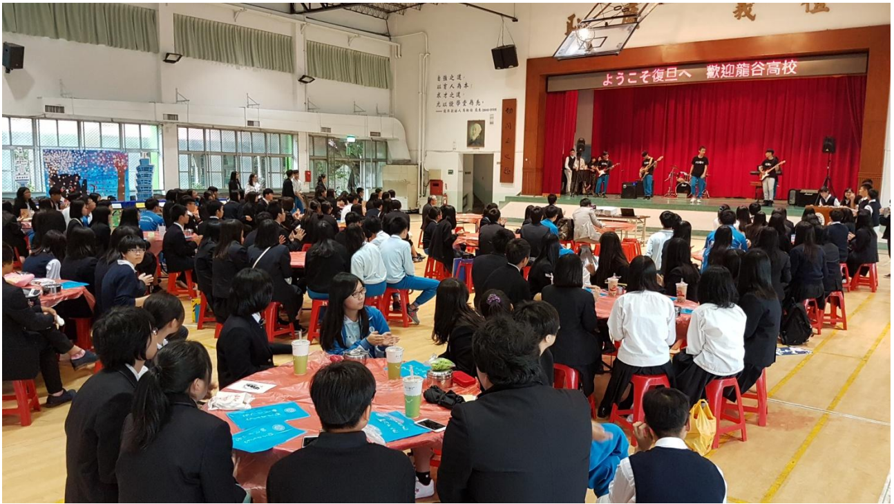
在禮堂舉行盛大餐會及社團表演，賓主盡歡。