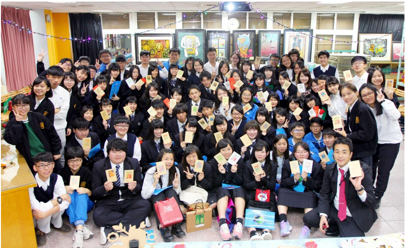
體驗活動：兩校師生印製別具特色的友好交流意象紀念章後合影。