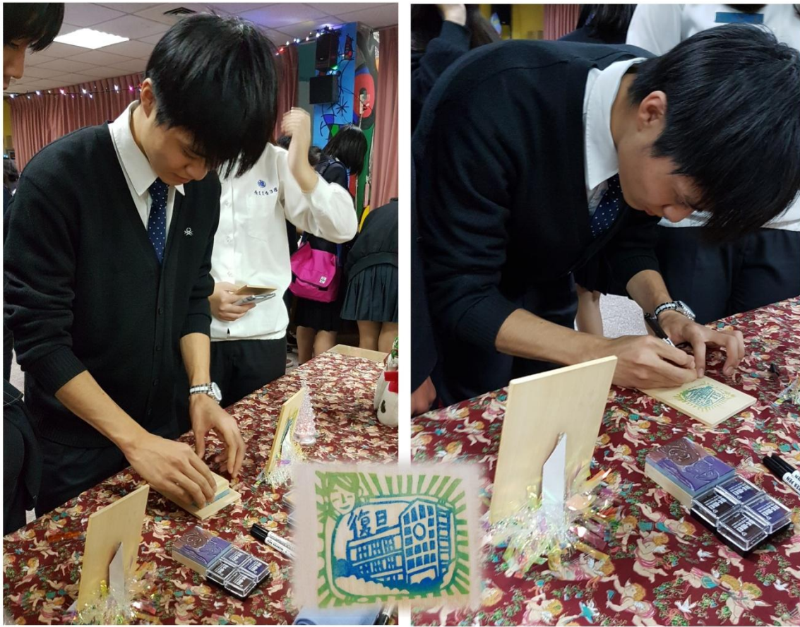
體驗活動：龍谷高校學生印製別具特色的友好交流意象紀念章。