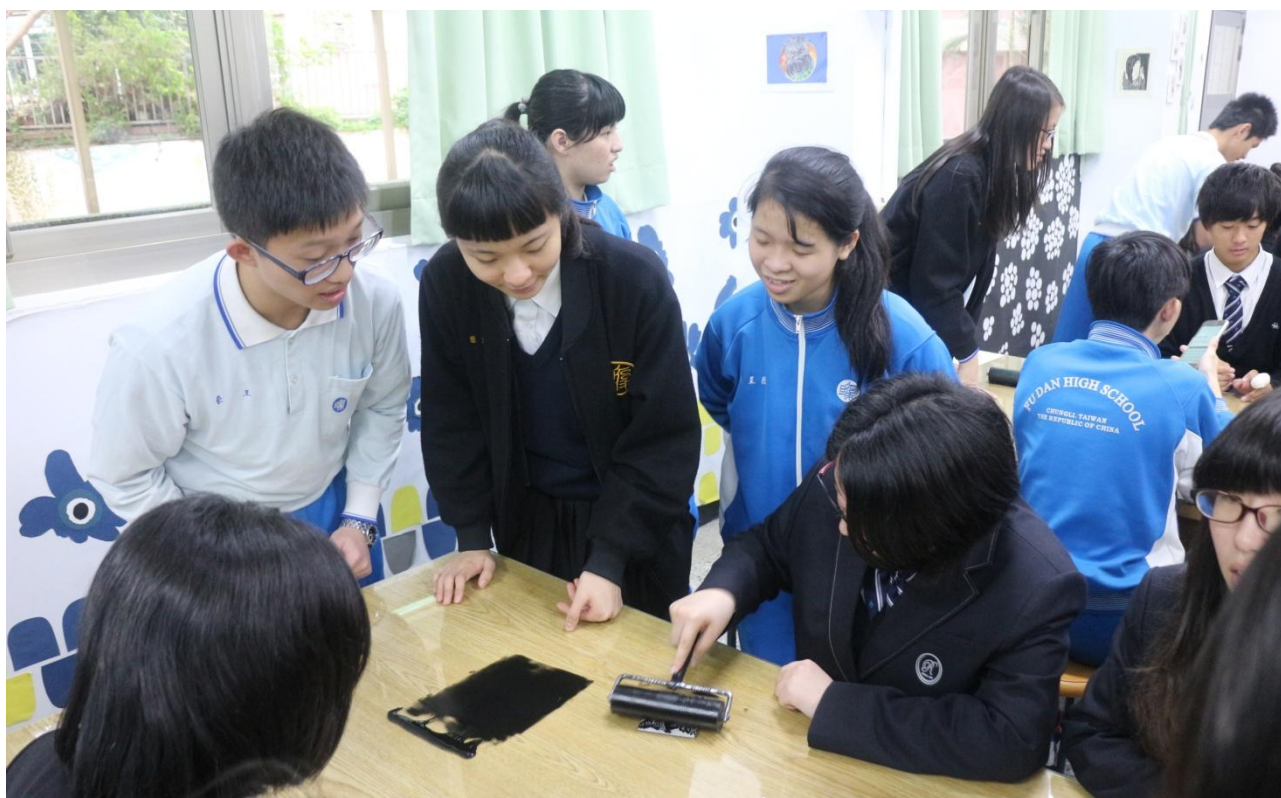
體驗活動：龍谷高校學生在復旦學伴指導下嘗試版畫製作