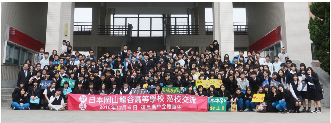
龍谷、復旦兩校交流師生於復旦高級中學校門口合影留念