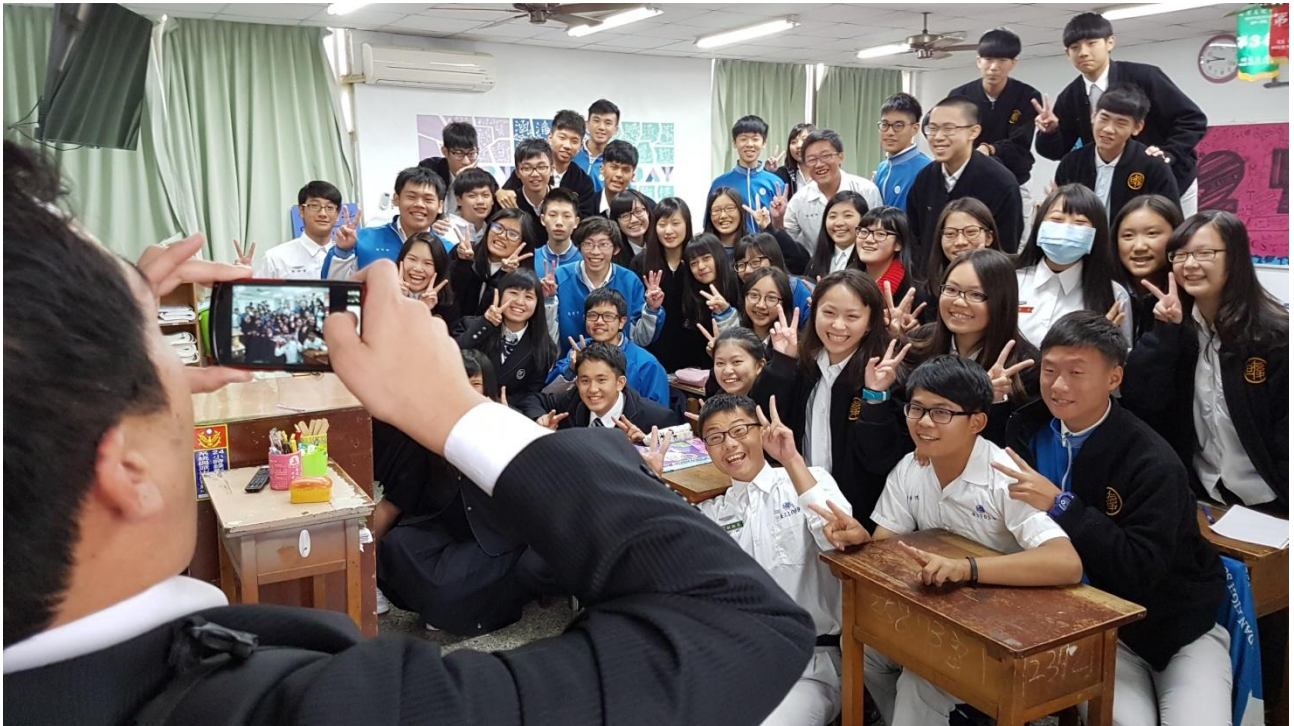
龍谷高校教師與入班交流的兩校學生熱情互動。