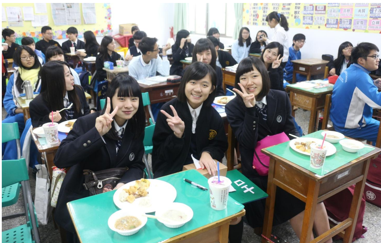
入班交流：體驗台灣特色小吃～蛋餅、豆漿、蚵仔麵線。