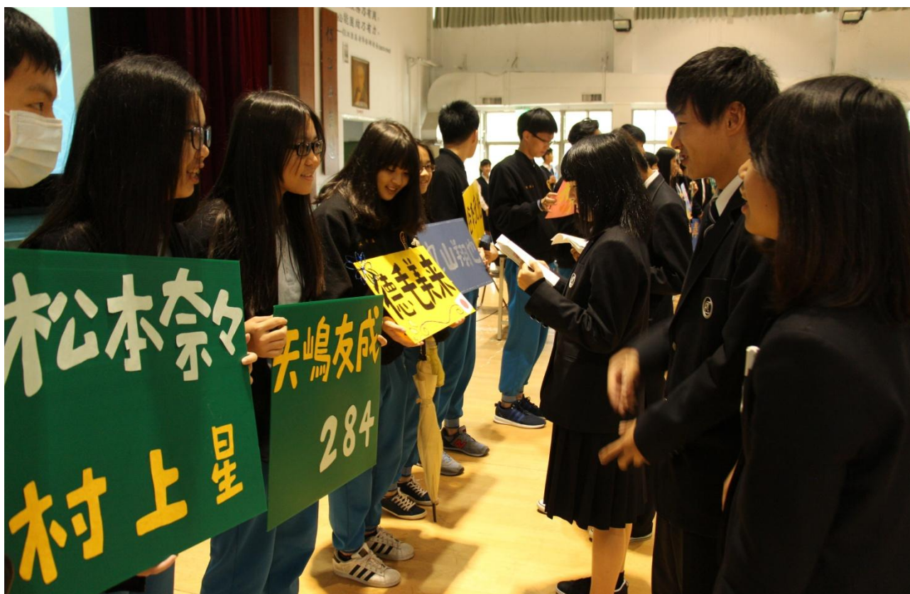
復旦學伴用心製作名牌與龍谷高校同學相見歡。