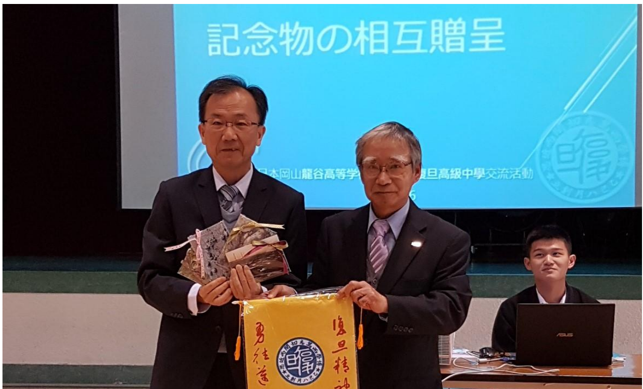
復旦致贈龍谷高校本校師生共同創作的藻礁生態主題明信片。