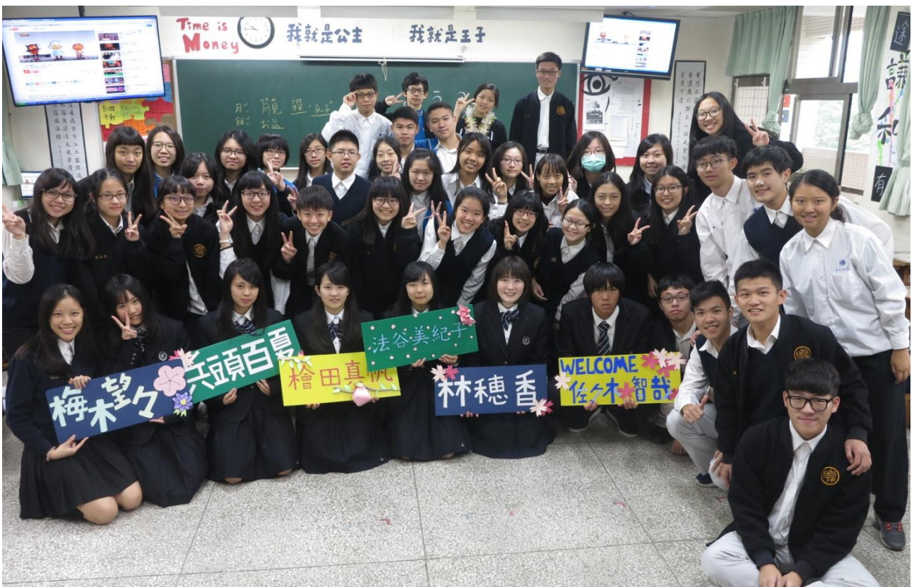
龍谷高校學生進入本校班級上課交流後與師生合影。