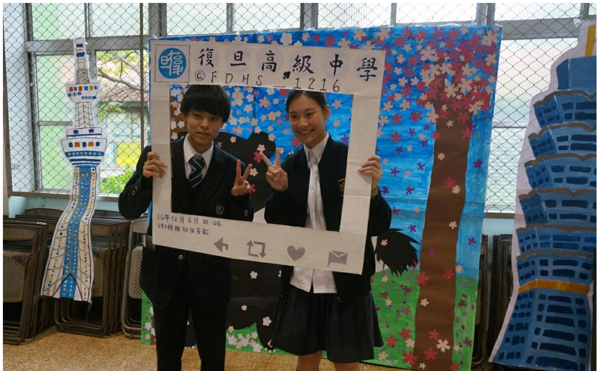
學伴於《台日友好交流紀念畫牆》前門口合影留念